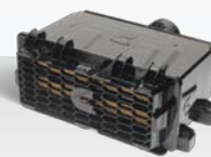
Direct Flow Filtración de Aire con Medio Filtrante de Nanofibra