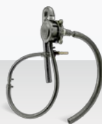
Ventilación de Cárter Abierta